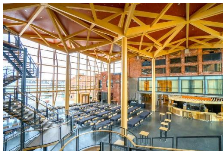
Sibeliushuset, konsertsalen & entréhallen